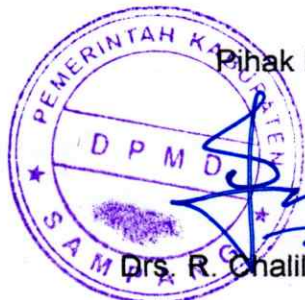
Pihak kedua Drs. R. Chalilurachman, M.Si

Pihak kedua akan melakukan supervisi yang diperlukan serta akan melakukan evaluasi terhadap capaian kinerja dari perjanjian ini dan mengambil tindakan yang diperlukan dalam rangka pemberian penghargaan dan sanksi.